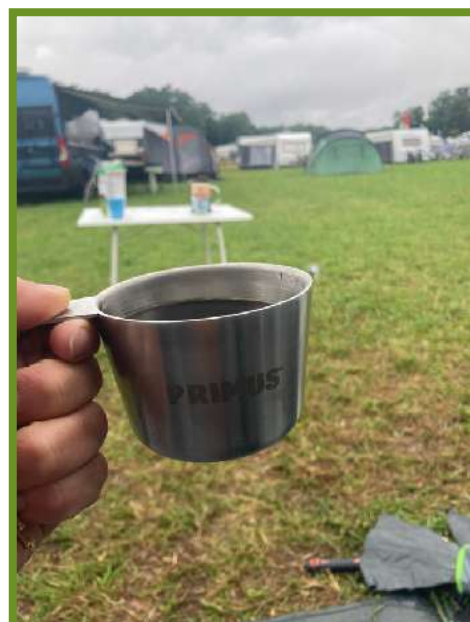
Campingmys med kaffekoppen i högsta bugg.